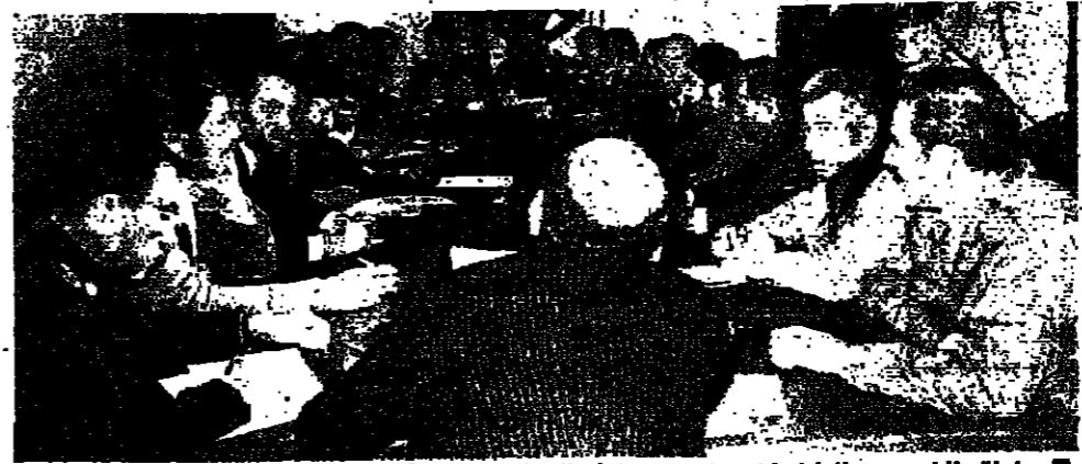
لجنة التنسيق العليا التمهيدية في السراي امس

تأهلت لجنة التنسيق العليا اجتماعاتها قبل ظهر امس في السراي كـ يغبياي رئيس الحكومة السيد رشيد كرامي والوزير غسان تويني، وذلك بسبب انعقاد جلسة مجلس الوزراء في نفس الوقت.